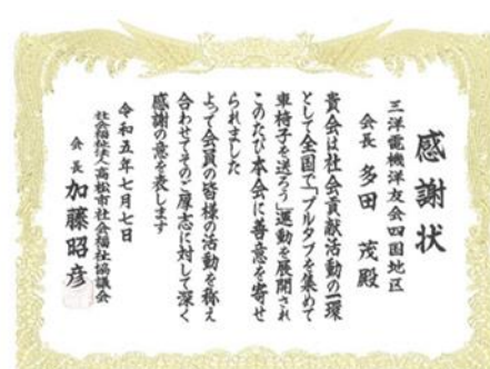
高松市社会福祉協議会からの感謝状