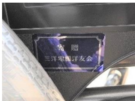
車いすに貼付したプレート