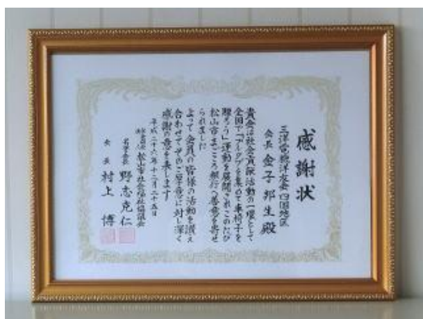
松山市社会福祉協議会からの感謝状