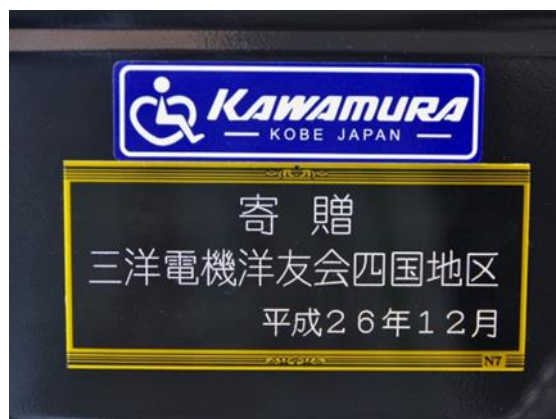
車椅子に貼付したプレート