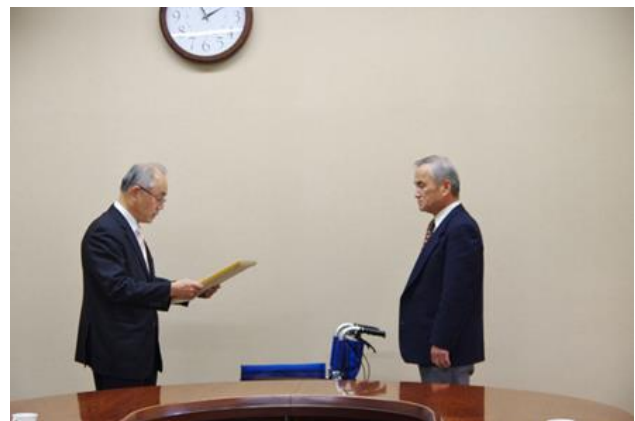
上河内常務理事から感謝状を受ける